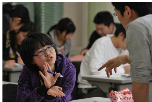
朝日新聞カメラマン 相場様からの寄贈

[タダゼミ]では、現役大学生等のボランティアが、みなさまの都立高校の受験を応援します。受験対策以外にも、勉強の仕方や、受験を乗り切するためのノウハウ、そして、進学意欲を高めるために、高校や大学とはどういったところなのか分かる座談会など、充実した講座を行います。単に入試で良い点数を取るためだけでなく、高校で実現したいことを考える機会の提供など、「一人ひとりの将来を考えた高校受験対策」を行うことを目指しています。